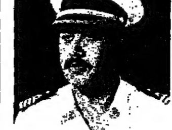
القطبان، بل أبيب ر، أ ب، ومف

مواصلة التحقيق مع «القطبان» الزعيم هلستكي، بل أبيب ر، أ ب، ومف